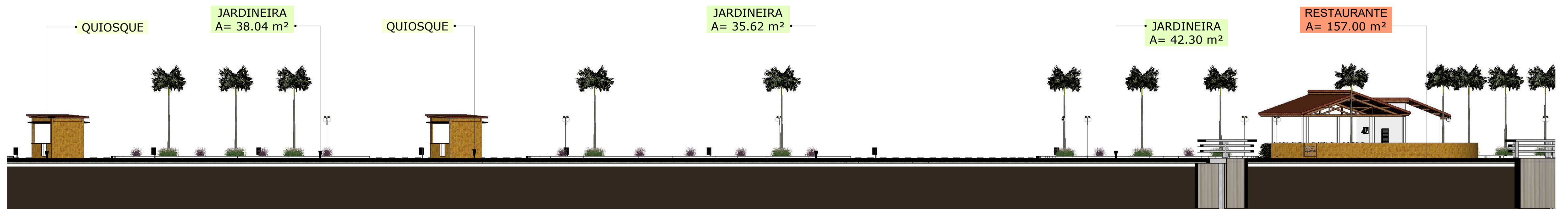
CORTE C-C ESC 1:150